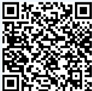
ብውሽጢ ኣፕ ዝግበር ዕድግታት

እንተድኣ ነቶም ናጻ ናይ ኣፕ ዕማማት ክትጥቀሙ ደሊኹም: ነቲ ብውሽጢ ኣፕ ዝግበር ዕድግታት ኣብ ሞባይልኩም ክትግግትዎ ትኽእሉ ኢኹም። ካልእ ድማ ናይ ሳልሳይ ኣካል ምዕጻው ግበሩ ኢኹም። ካብ ምዝገባታት ይሕልወኩም እዩ: ምኽንያቱ ሓንቲ ጌጋ ምጥቐቕ እኽልቲ እዩ። እምበኣርከስ ከምዚ ኢሉ እዩ ዝሰርሕ