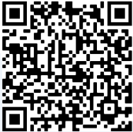
ናይ ሳልሳይ ኣካል ኣዳለውቲ